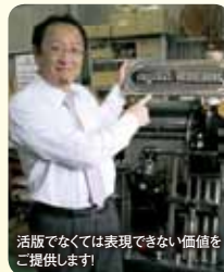
活版でなくては表現できない価値をご提供します!