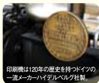
印刷機は120年の歴史を持つドイツの一流メーカーハイデルベルグ社製

我々が目指すのは、“ 協和でなくては ”と 言われる唯一無二の会社 。あらゆる印刷シーンで弊社をご用命いただけるよう、今年も全身全霊を持って取り組んで参ります。